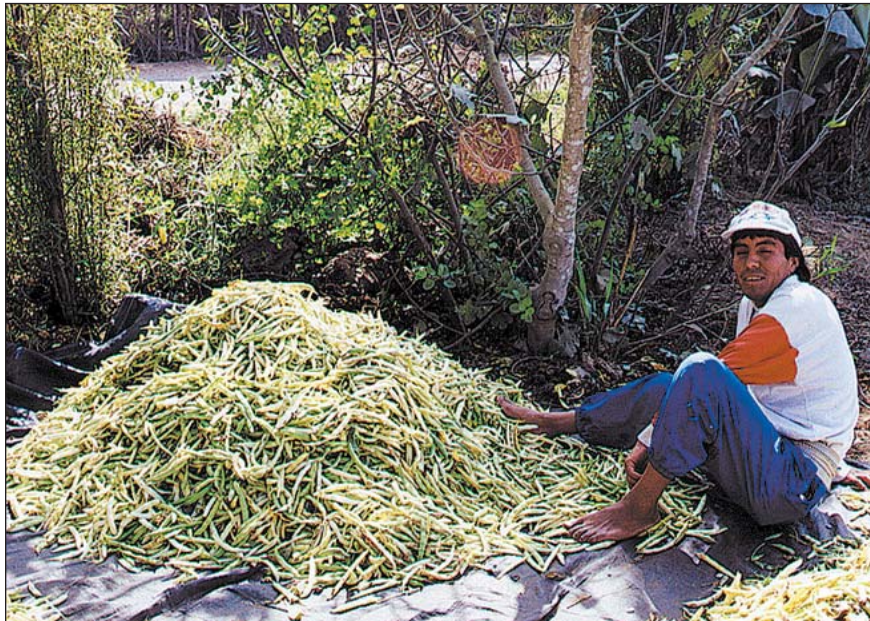
Buena producción menestrera fracasa por bajos precios, por la ausencia de planificación

Alentados por esta ayuda y con la esperanza de exportar sus cosechas,